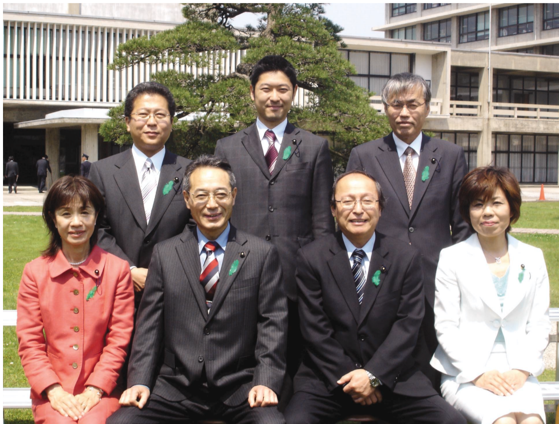
民主県民クラブの皆さんと

農水商工委員会は農林水産部、商工労働部、労働委員会、海区漁業調整委員会、内水面漁場管理委員会の所管に関する事項について審査および調査をする委員会です。私たちが日々食する農水産物の生産、地域の産業の振興、あるいは働く環境整備などいろいろな関心がある分野ですので、生活者の立場に立った私なりの視点で取り組んでいこうと考えています。このほかに、私は議会の